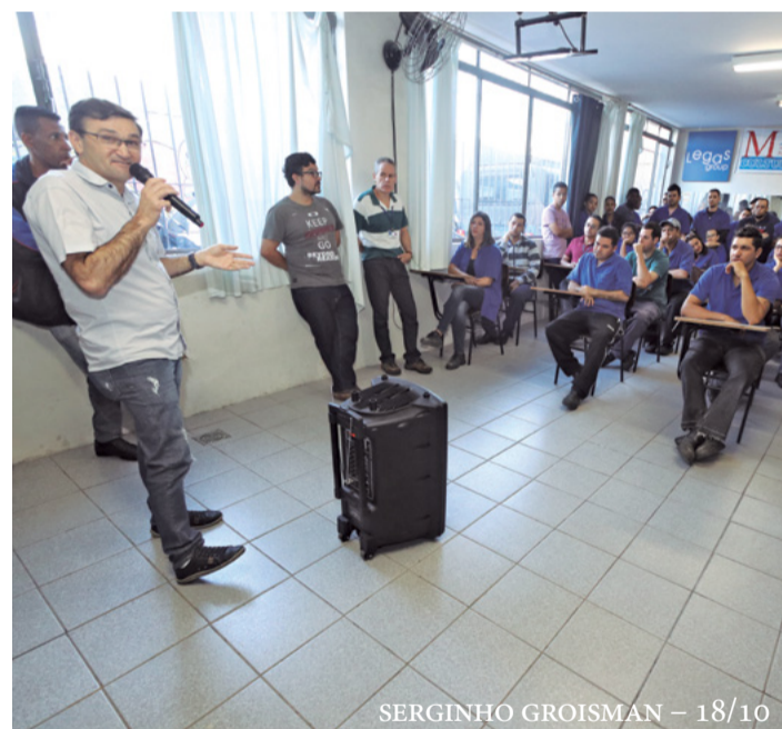
SERGINHO GROISMAN – 18/10